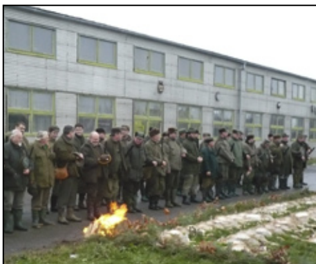
Seničtí myslivci a jejich přátelé na výřadu po honě dne 29.11.2008

Celá schůze probíhala ve sváteční atmosféře a nesla znaky dobře vykonané práce při realizaci tohoto náročného koníčka jak jednotlivými členy, tak i pro vlastní obec. Neboť myslivci každoročně v jarních měsících po dohodě s OÚ provádí úklid odpadu kolem místních komunikací.