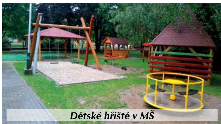
Dětské hřiště v MŠ