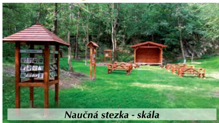
Naučná stezka - skála