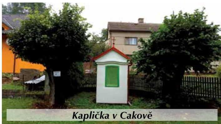
Kaplička v Čakově